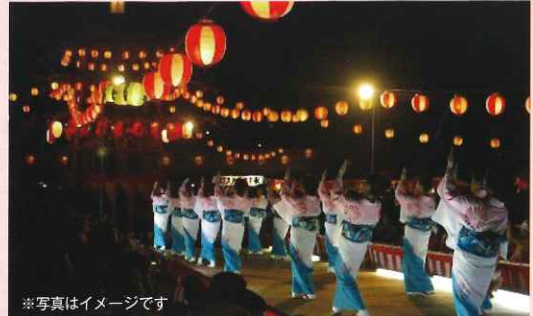
※写真はイメージです

コンサート終了後、各自で帰宅(帰りの交通費は、各自ご負担ください) * 所沢駅からも乗車可能です。(ご旅行代金に変更はありません) * 売り切れ次第募集終了させていただきます。予めご了承ください。