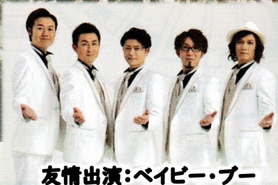
友情出演：ベイベー・ブー