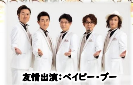
友情出演: ベイビー・ブルー

12:00 開場 12:30～13:30 第1ステージ 13:50～14:20 第2ステージ 14:40～15:50 第3ステージ